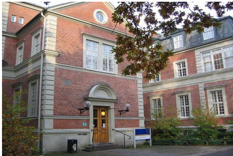
Samhällsvetenskapliga fakultetens bibliotek, mitt i västra delen av kvarteret "Paradis", rakt norr om Universitetsplatsen och Lundagård.

Lokaler Institutionskarta: < http://www.lu.se/sites/www.lu.se/files/institutionskarta_lund_2014.pdf >