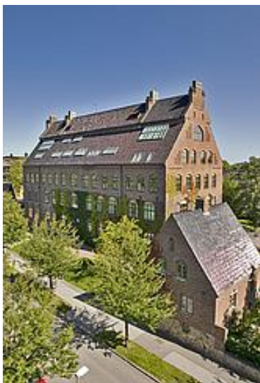
Geocentrum I. Den mindre byggnaden t.h. är GIS-centrum. Geocentrum II skymtar längst t.v.

Examinationen på denna delkurs är i form av en hemtentamen . Instruktion för tentamen ges på blanketten med uppgifter (LiveATLund). Uppgifter ges under kursens gång via LiveATLund. Fullständig tentamen ges 10.2 – inlämnas senast 20.2 när nästa delkurs börjar ("Människans plats i ekosystemen"). Omtentamen (med helt nya uppgifter) ges 4.3 – inlämnas enligt instruktion senast 13.3. Tentamens- och omtentamensuppgifter finns under ovan nämnda perioder tillgängliga som dokument på LiveATLund. Du kan räkna med att en tentamen är rättad senast den dag då en omtentamen utdelas, men ej nödvändigtvis tidigare.